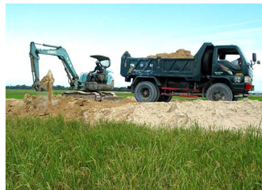
Đào múc đắp đường giao thông trên đồng phía tây Cây Găng.

Cả nước có 78 triệu thửa ruộng, có những thửa chỉ rộng cỡ 20m 2 , thì ở huyện Cam Lâm có gần 40 ngàn thửa ruộng với diện tích thửa nhỏ nhất là 40m 2 . Chính tình trạng có “ruộng tốt, ruộng xấu, có gần, có xa, có cao, có thấp” phân tán, nhỏ lẻ, không những gây “khó” trong sản xuất, thâm canh tăng vụ, tốn kém nhiều thời gian và sức lao động, mà còn “vướng” khi áp dụng các tiến bộ khoa học kỹ thuật, đưa cơ giới hoá vào sản xuất trên đồng ruộng... Vì vậy, giá trị canh tác trên 1ha đất nông nghiệp đạt ở mức thấp - khoảng 20