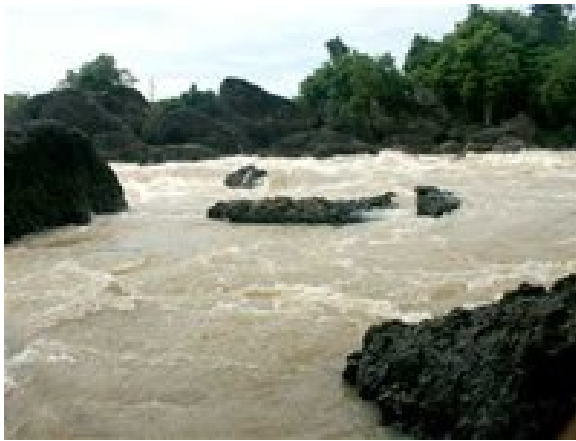
Một góc thác Trinh Nữ ở tỉnh Dak Nông, nơi con sông Srepok chảy qua

Nguồn nước dòng sông Srepok chảy qua địa phận tỉnh Dak Lak đang ngày càng bị ô