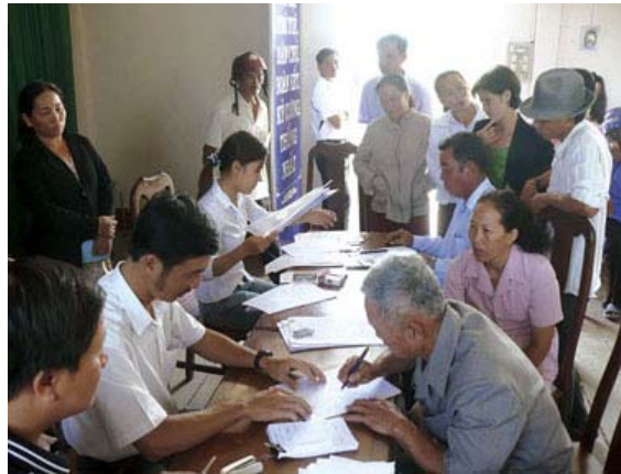
Nông thôn – nông dân đang “khát” vốn

Một trong những chính sách đáng chú ý trong vài ngày gần đây là Chính phủ đã ban hành Nghị định số 41/2010/NĐ-CP của Chính phủ về chính sách tín dụng phục vụ phát triển nông nghiệp, nông thôn. Với Thông tư hướng dẫn từ Ngân hàng Nhà nước, giờ đây các hộ nông dân trong cả nước có thể vay ngân hàng đến 50 triệu đồng mà không cần tài sản thế chấp. Còn