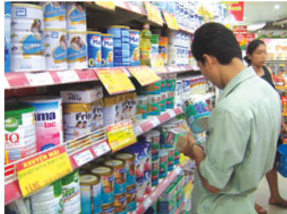
Trong hàng chục nhãn sữa bột nhập khẩu, chỉ có một nhãn sữa cam kết với siêu thị giữ giá bán đến hết năm

Thực tế giá bán khi đến tay người tiêu dùng còn tăng cao hơn. Theo khảo sát của chúng tôi tại các đại lý, sữa Ensure Gold được phân phối ở mức từ 220.000 - 230.000 đồng/hộp 400g, và 480.000 đồng/hộp 900g.